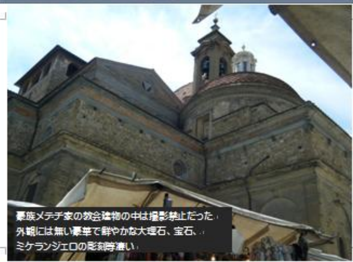
豪族メテチ家の教会建築物の中は撮影禁止だった。 外観には無い豪華で群やかな大理石、宝石、 ミケランジェロの彫刻等凄い。