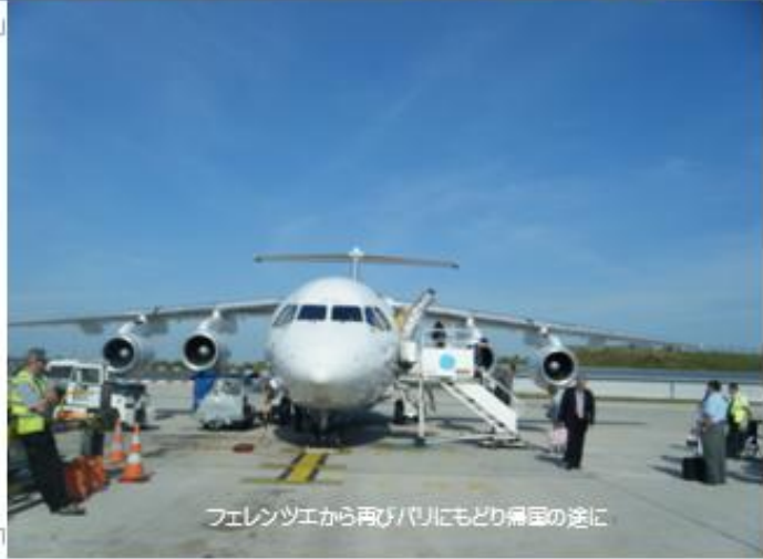
フェレンツエから再びパリにもどり帰国の途に