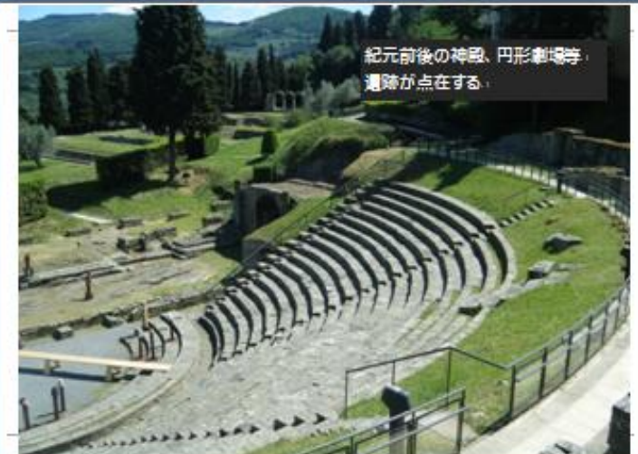
紀元前後の神殿、円形劇場等、 遺跡が点在する。