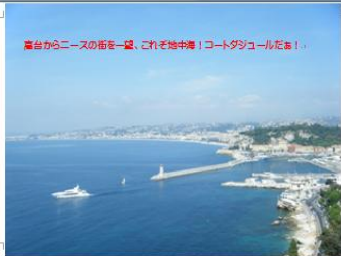
高台からニースの街を一掃、これぞ地中海！コートダジュールだあ！