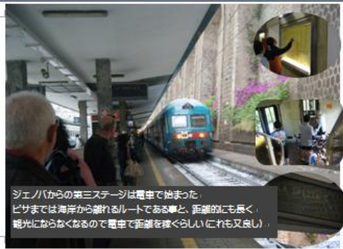
ジェノバからの第三ステージは電車で始まった。 ピサまでは海岸から離れるルートである事と、距離的にも長く、 観光にいらなくなるので電車で距離を稼ごう(これも又よし)。