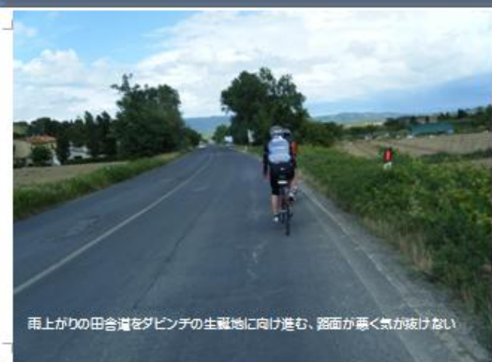
雨上がりの田舎道をダビンチの生誕地に向け進む、路面が悪く気が抜けない。