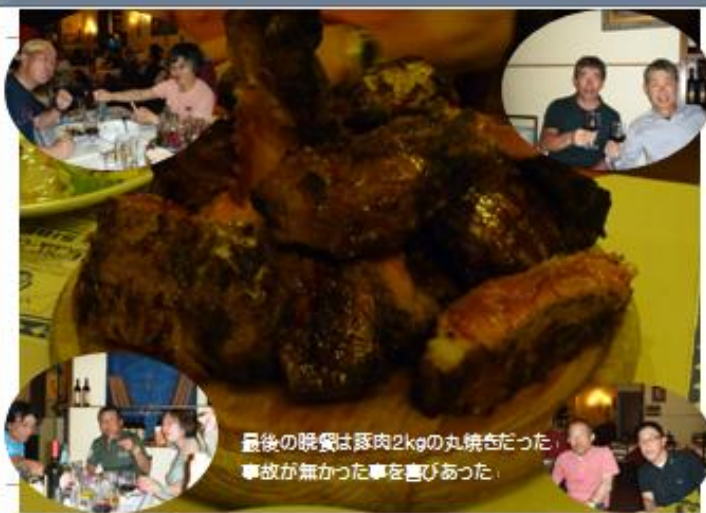
最後の晩餐は豚肉2kgの丸焼きだった。 事故が無かった事を喜びあった。