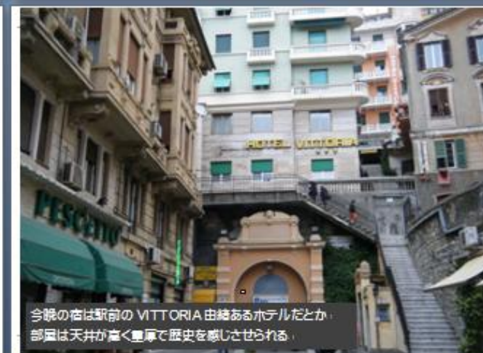
今晚の宿は駅前の VITTORIA 由緒あるホテルだとか、 部屋は天井が高く豊厚で歴史を感じさせられる、