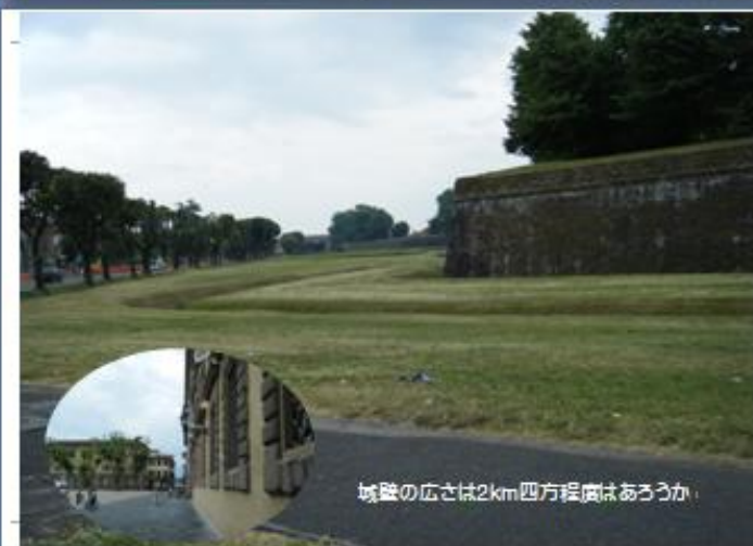
城壁の広さは2km四方程度はあろうか。