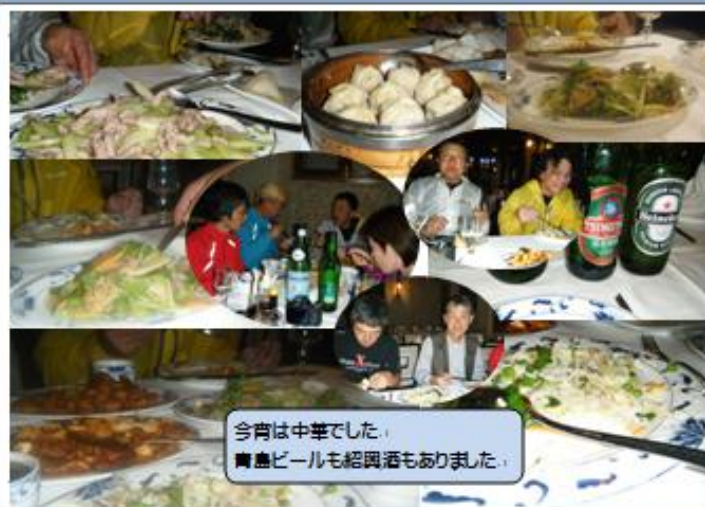
今宵は中華でした。 青島ビールも紹興酒もありました。