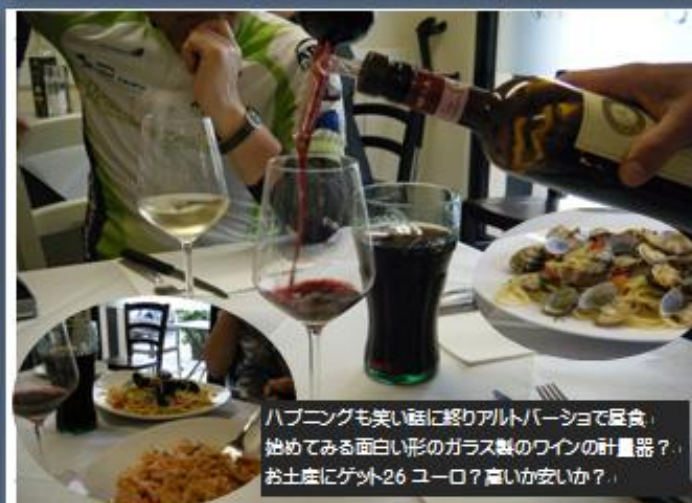
ハブリングも美しい庭に終りアルトバーショで昼食。 始めてみる面白い形のガラス製のワインの計量器？ お土産にゲット26ユーロ？高いか安いかな？