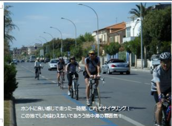
ホントに良い感じで走った一時期、これぞサイクリング！ この地でしか味わえないであろう地中海の雰囲気！