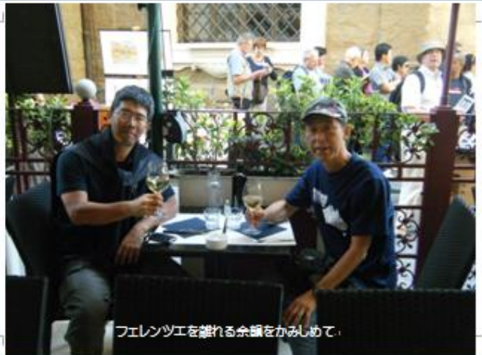
フェレンツエを離れる余韻をかみしめて。