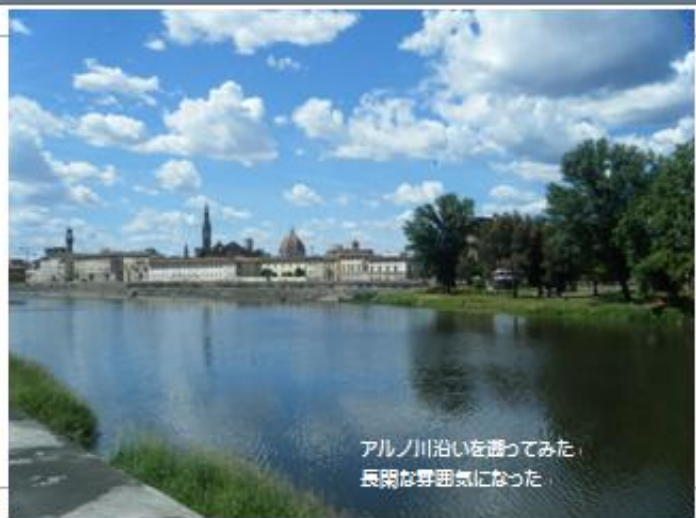
アルノ川沿いを遊ってみた。 長閑な雰囲気になった。