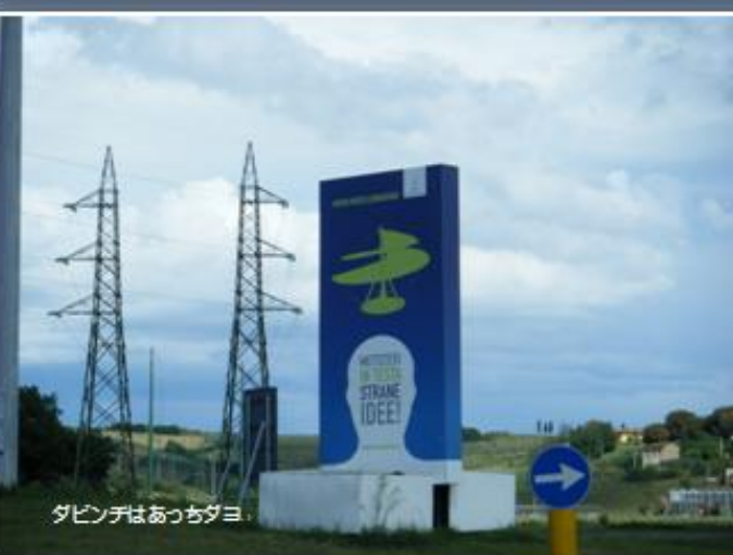
ダビンチはあっちだよ。