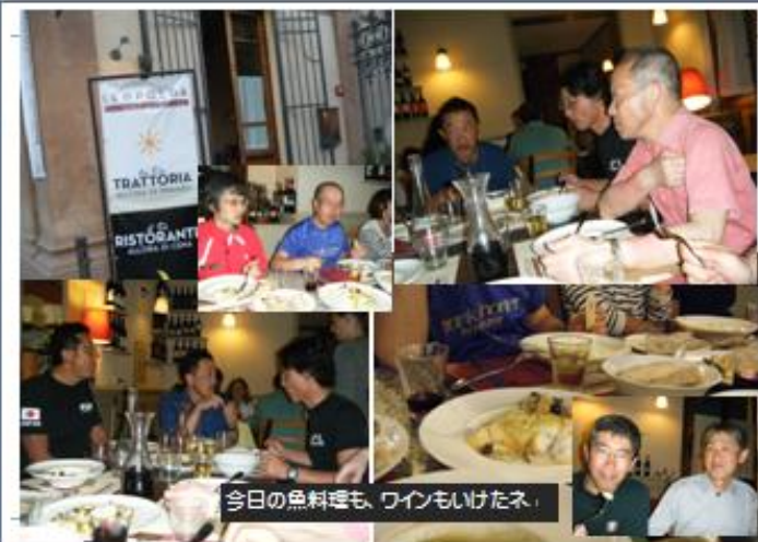
今日の魚料理も、ワインもいけたネ。