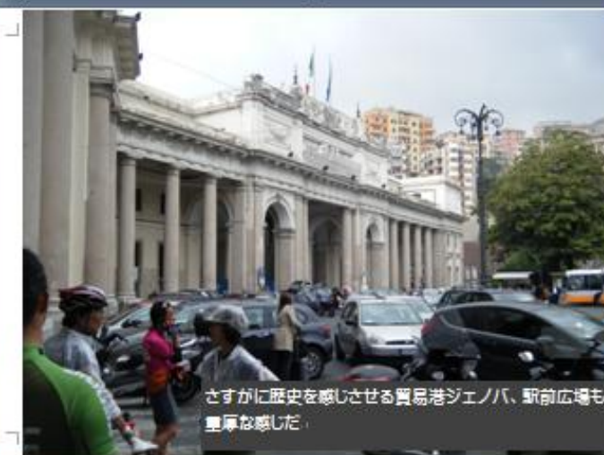
さすがに歴史を感じさせる貿易港ジェノバ、駅前広場も 豊厚な感だ、