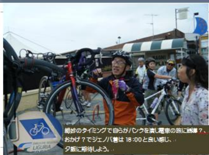
絶妙のタイミングで自らがリンクを演じ電車の旅に誘導？、 おかげ？でジェノバ着は 18:00 と良い感じ、 夕飯に期待しよう、