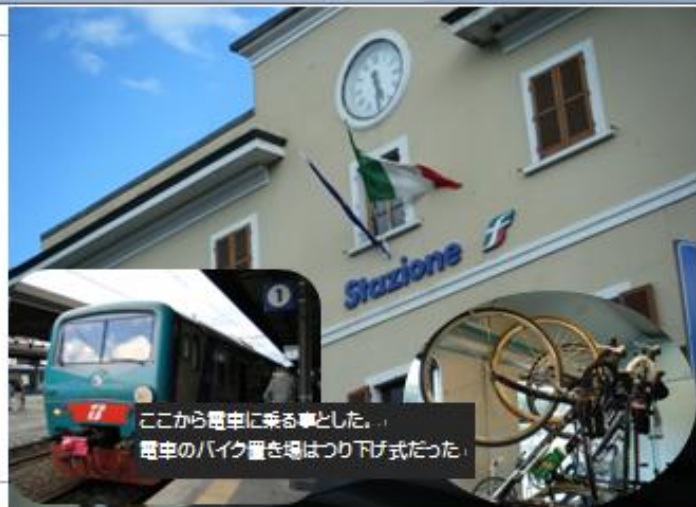
ここから電に乗る事とした。 電車のバイク置き場はつり下げ式だった。