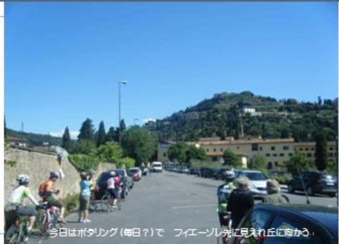
今日はポタリング(毎日?)で フィエーソ先に見えれ丘に向かう。