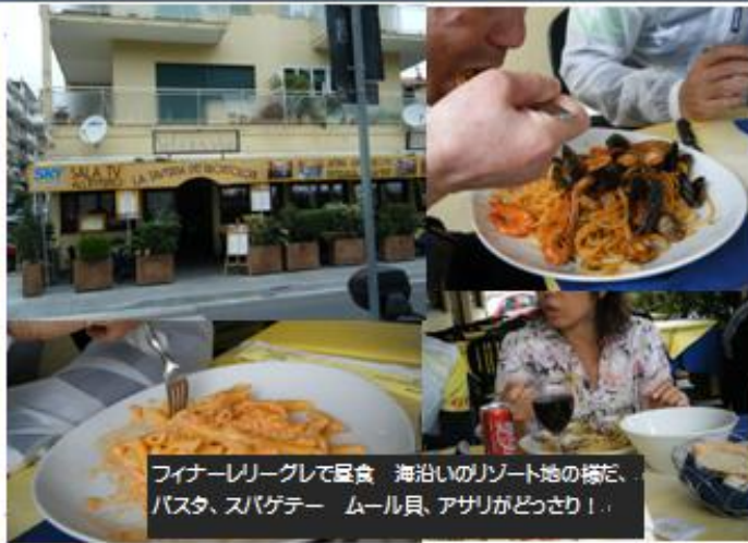
ファイナーリーグして昼食 海沿いのリゾート地の様だ、 パスタ、スパゲッテ ムール貝、アザリがどっさり！