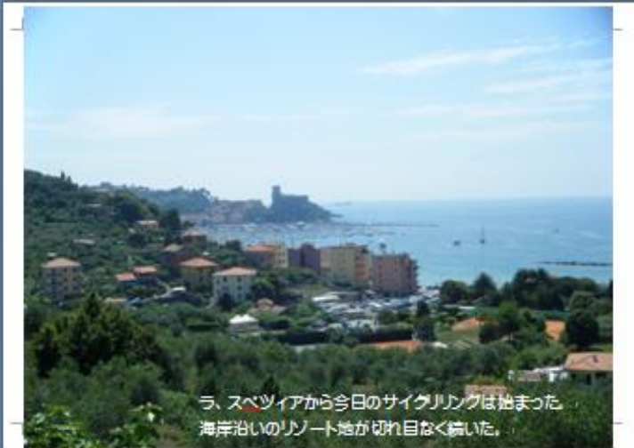
ラ、スペツィアから今日のサイクリングは始まった。 海岸沿いのリゾート地が切れ目なく続いた。