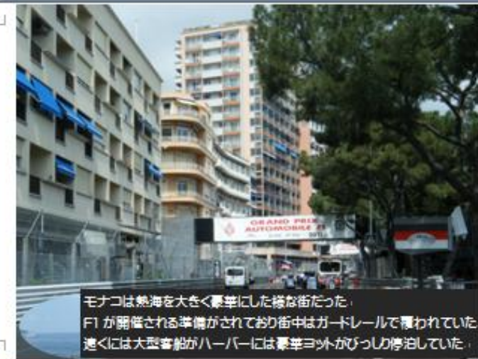
モナコは熱海を大きく豪華にした様な街だった。F1 が開催される準備がされており街中はガードレールで覆われていた。速くには大型客船がハーバーには豪華ヨットがびっしり停泊していた。