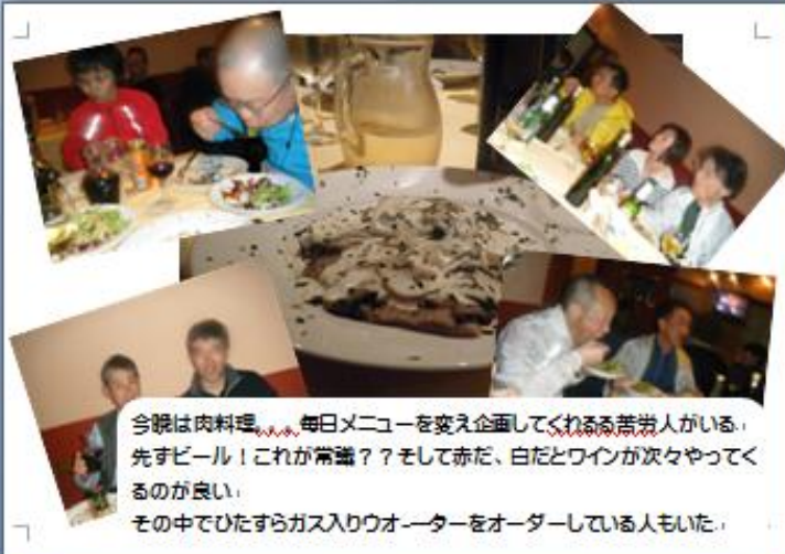
今晚は肉料理... 毎日メニューを変え企画してくれる若手さんがいる。 先ずビール！これが常識？？そして赤だ、白だワインが次々やってくるのが良い。 その中でひたすらガス入りウォーターをオーダーしている人もいた。