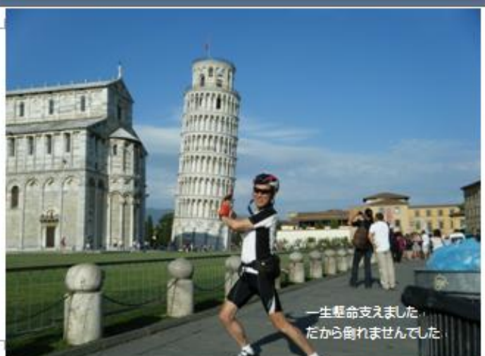
一生懸命支えました。 だから倒れませんでした。