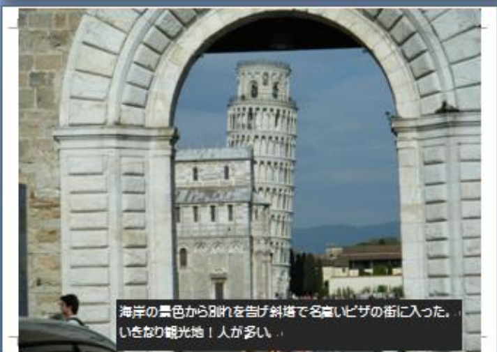
海岸の景色から別れを告げ斜塔で有名なピサの街に入った。 いきなり観光地！人が多い。