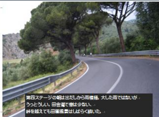
第四ステージの朝は出だしから雨模様。大した雨ではないが、うっとうしい。田舎道で車は少ない。峠を越えても田舎風景はしばらく続いた。