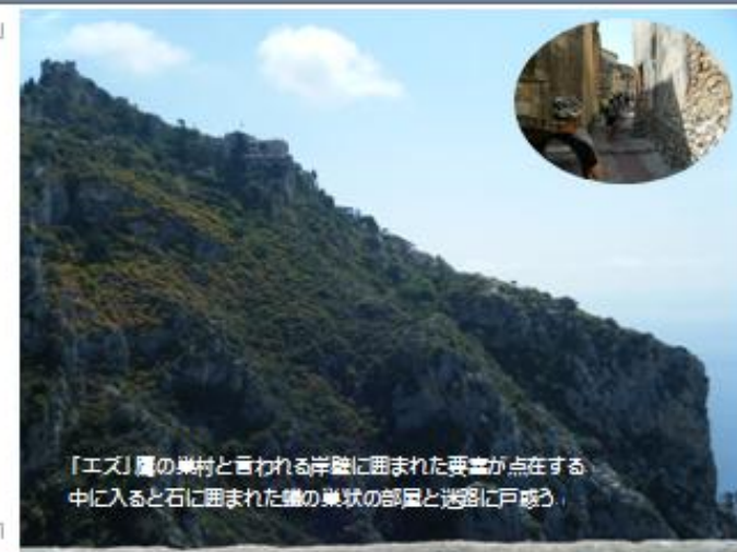
「エズ」属の集村と言われる岸壁に囲まれた要害が点在する中に入ると石に囲まれた壁の集村の部屋と迷路に戸惑う。