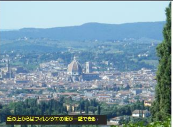
丘の上からはフィレンツェの街が一望できる。