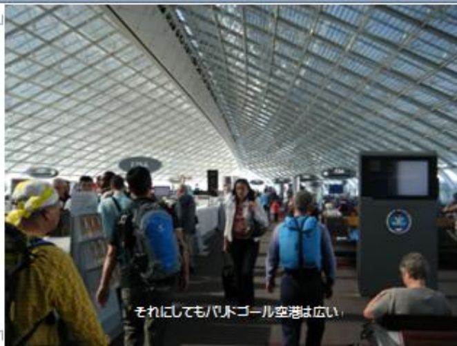
それにしてもパリトゴール空港は広い。