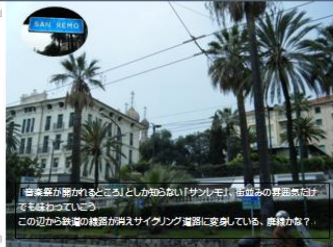
音楽祭が開かれるところ」としか知らない「サンレモ」、街並みの雰囲気だけでも伝わっている。この辺から鉄道の線路が消えサイクリング道路に変身している、廃線かな？