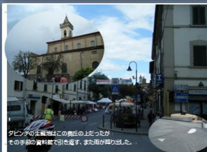
ダビンチの生誕地はこの奥丘の上だったが、その手前の資料館で引き返す、また雨が降り出した。