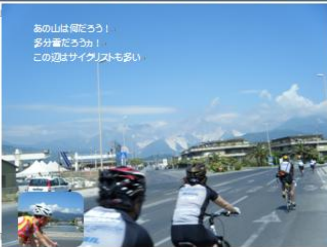
あの山は何だろう！ 多分着たろうか！ この辺はサイクリストも多い。