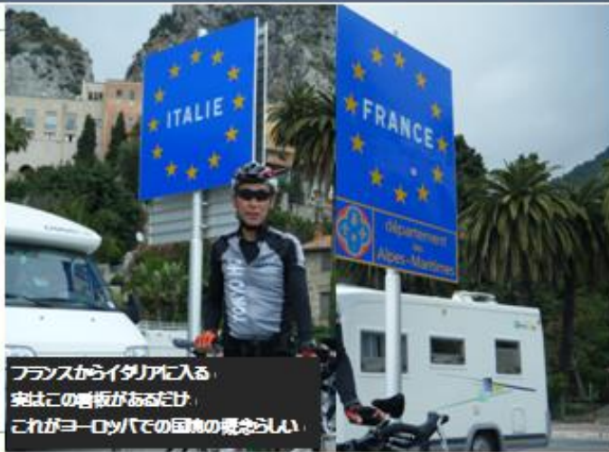
フランスからイタリアに入る。案はこの看板があるだけ。これがヨーロッパでの国境の概念らしい。