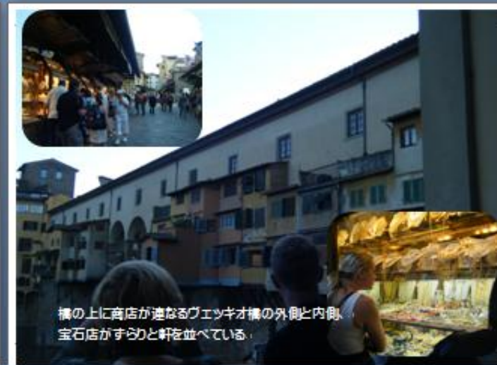
橋の上に商店が連なるヴェッキオ橋の外側と内側、 宝石店がすらりと軒を並べている。