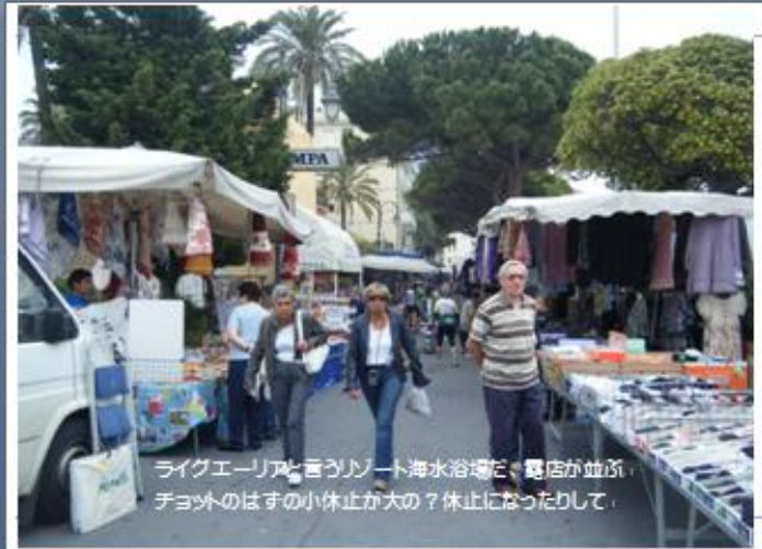
ライグエーリアと言うリゾート海水浴場だ、露店が並び、 チョットのはずの小休止が大の？休止になったりして、