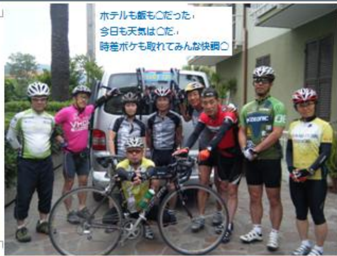
ホテルも飯も○だった、 今日も天気は○だ、 時差ボケも取れてみんな快調○