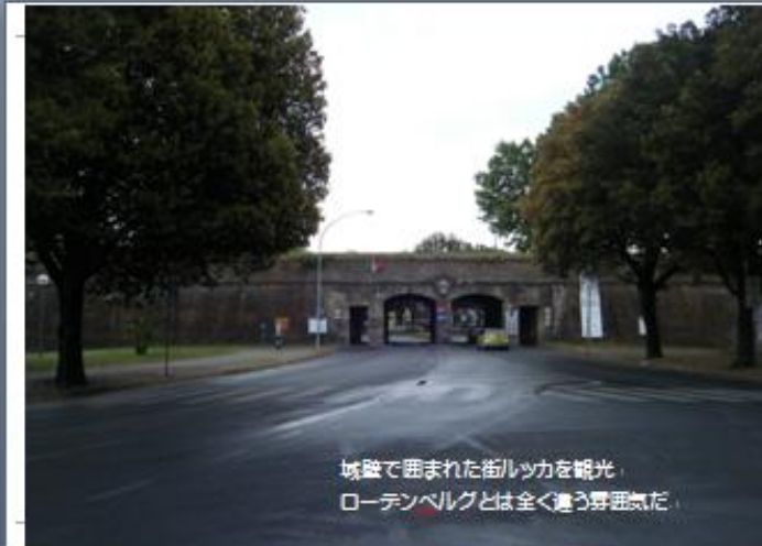
城壁で囲まれた街ルッカを観光 ローテンベルグとは全く違う雰囲気だ。