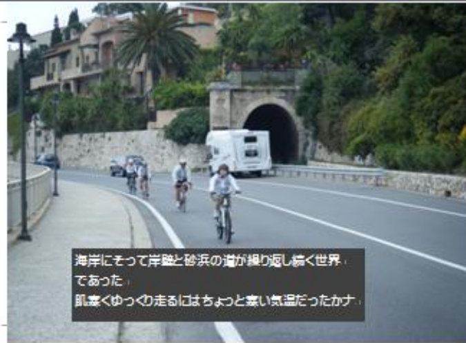
海岸にそって岸壁と砂浜の道が繰り返し続く世界、 であった。 肌寒くゆっくりの走るにはちょっと寒い気温だったかな、