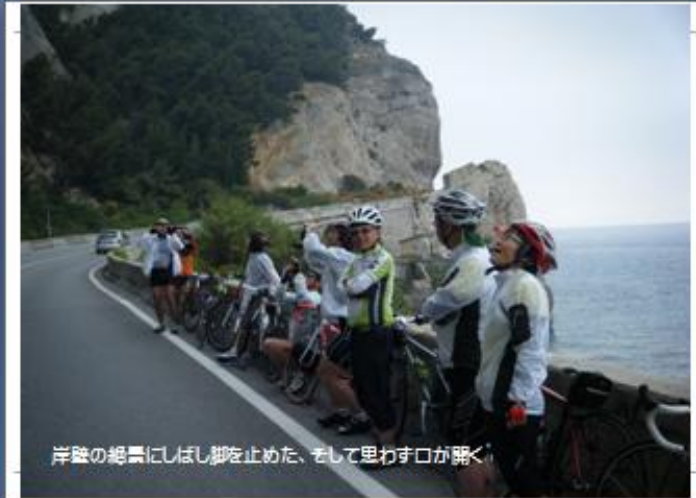
岸壁の絶景にしばし脚を止めた、そして思わず口が開く、