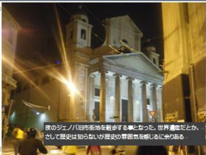
夜のジェノバ旧市街地を散歩する事となった。世界遺産だとか、 さして歴史は知らないが歴史の雰囲気を感じるに余りある。