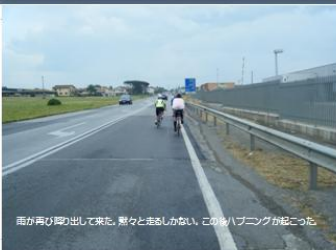
雨が再び降り出して来た。黙々と走るしかない。この後ハブリングが起こった。