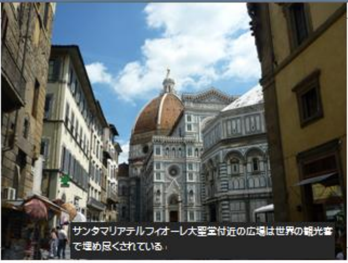
サンタマリアデルフィオーレ大聖堂付近の広場は世界の観光客 で埋め尽くされている。