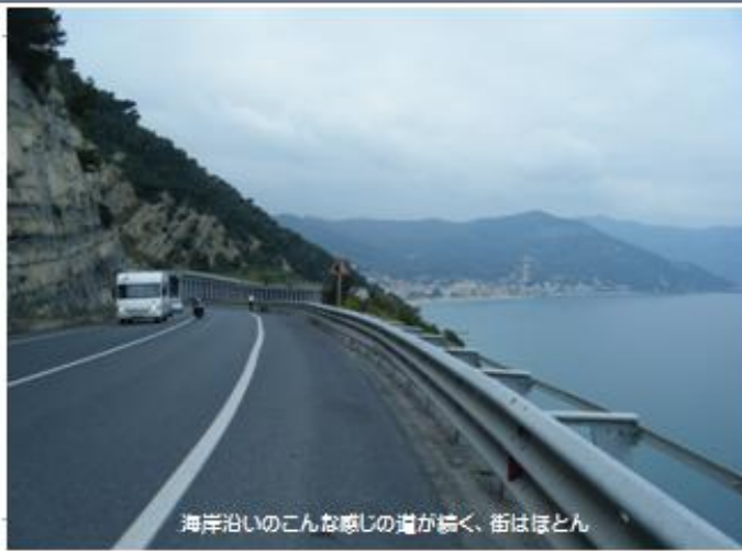
海岸沿いのこんな感じの道が続く、街はほとんど